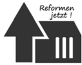
Konzil von unten